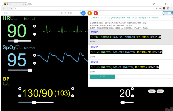
タブレット/PC利用時のコントローラ画面