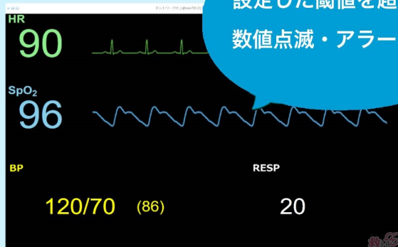
見慣れたモニタ画面