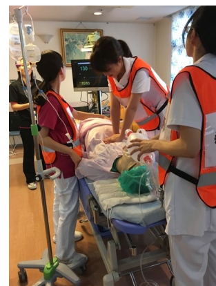
訓練利用時の様子