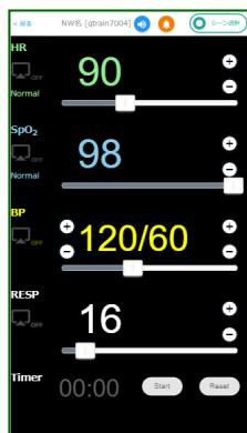
スマホ利用時の コントローラ画面