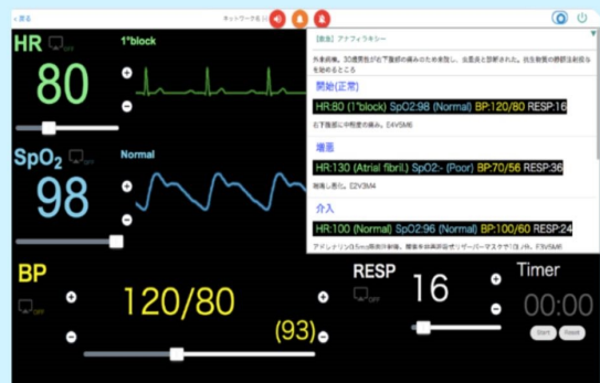
タブレット/PC利用時のコントローラ画面